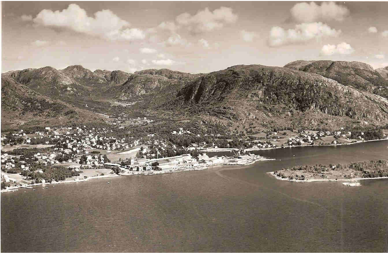
Staalverksområdet og sentrum.