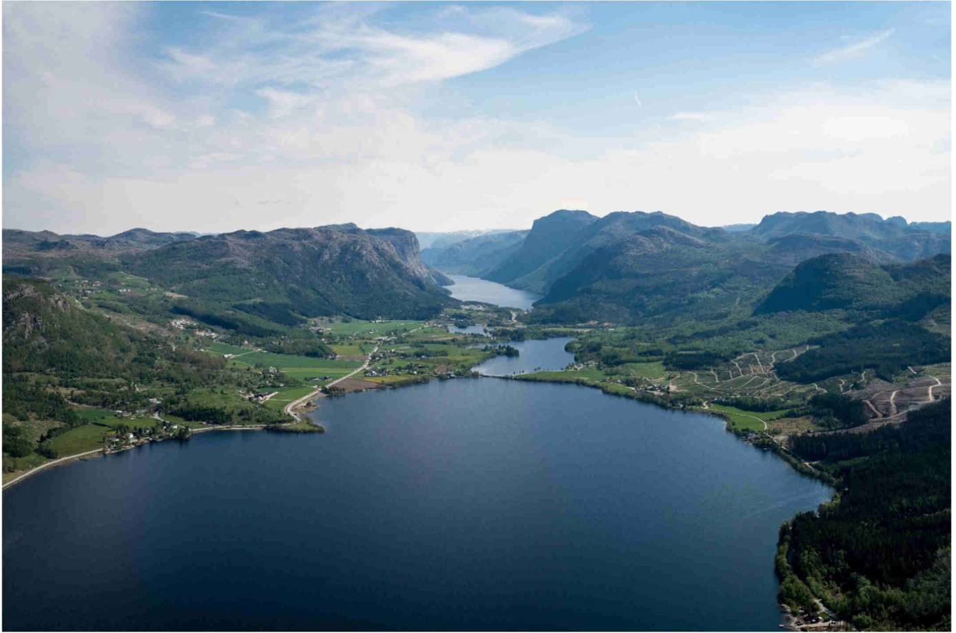
Oversiktsbilde av Bjørheimsbygd